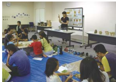
親子考古学教室(土器作り)