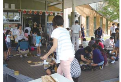
まいぶん祭り(火起こし)

「親子考古学教室」では小学生（3年生以上）と保護者が火起こしや土器作り・勾玉作りを行いながら、昔の暮らしに思いを巡らせました。最後に作品と記念撮影をし、夏の思い出を残しました。