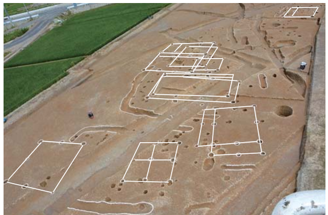
鎌倉時代の集落（掘立柱建物）