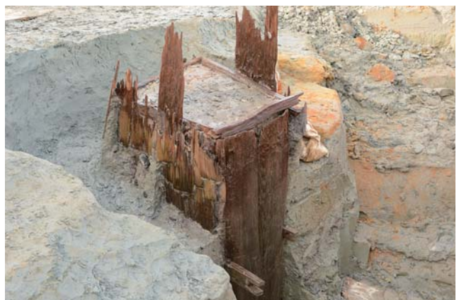
大型井戸の井戸側（手前が刳り船材と見られます。）