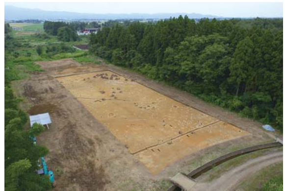
調査区全景(東から)

二反割遺跡の建物は、一定の間隔を保ち計画的に配置され、建物同士に重複が少ないことが特徴で、集落が比較的短期間で移転したことが分かります。今後、周辺の集落遺跡の動向を合わせて検討することで、飯田川流域の中世の様相が解明されることが期待されます。(山崎忠良)