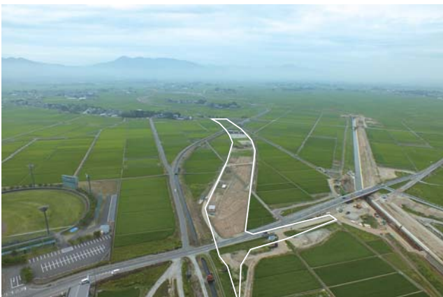
遺跡近景（白線範囲が調査対象範囲）