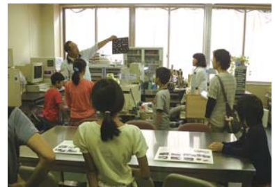
まいぶん祭り(保存処理室見学)