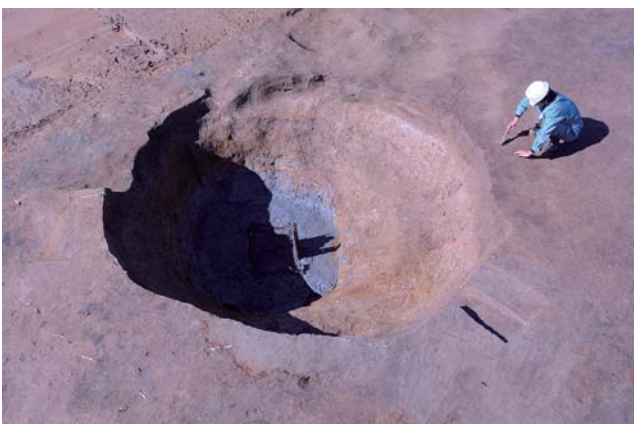
鎌倉時代の大型井戸（直径3m）