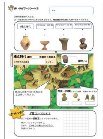
まいぶんワークシート

平成28年度も積極的に校外学習や出前授業に対応します。下記活動例のように周辺施設も合わせた複合的な校外学習をお勧めしています。詳細についてのお問い合わせなどは（公財）新潟県埋蔵文化財調査事業団普及班までお気軽にどうぞ。