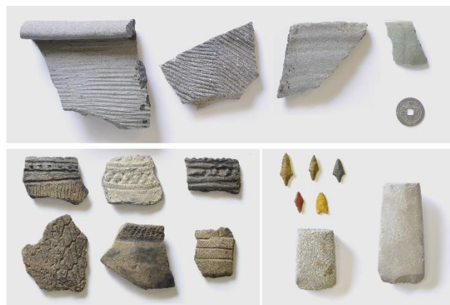
出土遺物（上：中世珠洲焼・銭貨 下左：縄文時代晚期土器 下右：縄文時代石器）