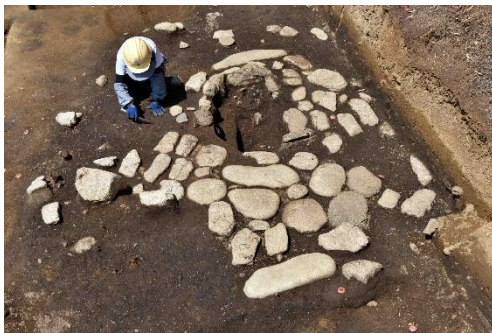
石が敷かれた建物 ※最後の公開です