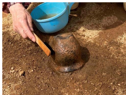
完全な形で出土した土器