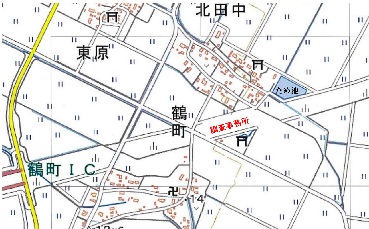
国土地理院地図 GSI Maps (縮尺任意)