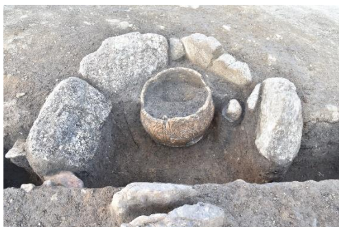
土器を入れた石囲炉