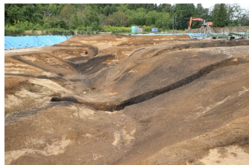
縄文時代の谷と廃棄場