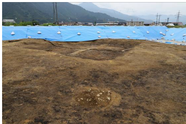
古墳時代の周堤が残る竪穴建物と土坑の様子