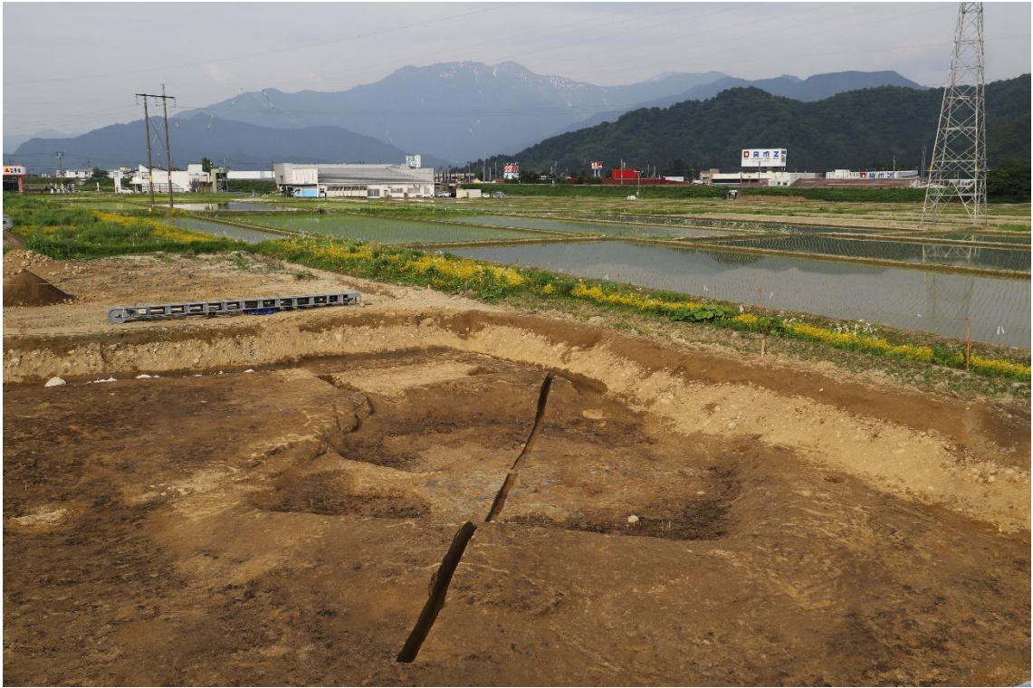
竪穴建物と八海山（西から）