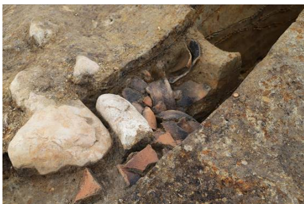
竪穴建物の壁際で出土した土師器