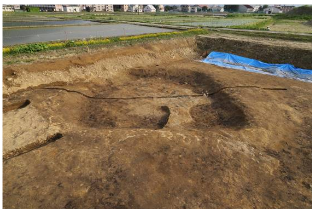
古墳時代の周堤が残る竪穴建物の様子