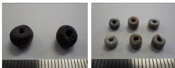
遺跡から出土した土製丸玉（左）・白玉（右）