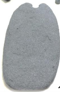
ペンダントトップ

勾玉のほか、ペンダントトップや管玉・白玉が出土しました。これらは、すべて連ねてネックレスとして利用されたと考えられます。中でもメノウの勾玉は、大きく優品であることから、権威の象徴であった可能性があります。