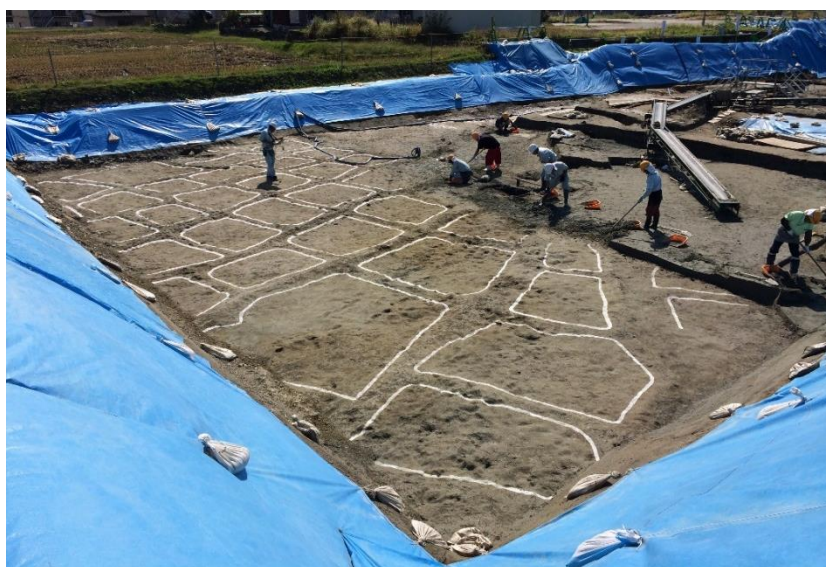
整然と整備された水田

水田の区画は、当時の地形に沿うように設計されたようで、上の水田から下の水田へと水を落としていくような構造とみられます。古墳時代の水田は、県内でも発見例が少なく、貴重な資料といえます。