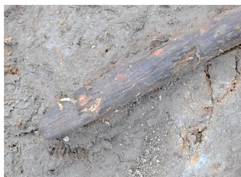
古墳時代の弓（長さ 130 cm）

両端部には弦を張るための加工がなされています。材質は、ハイヌガヤなど弾力性に富んだ素材と考えられます。