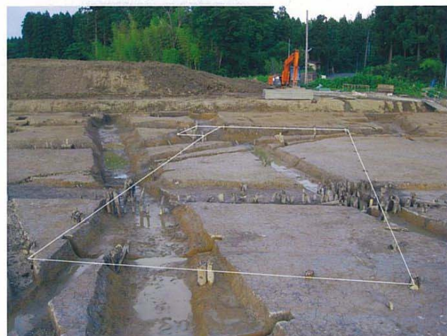
掘立柱建物（西から）

ピット 260、270グリッド、24Rグリッド付近にやや多く集中します。規模が大きく深いものもありますが、柱穴列や掘立柱建物になっていません。