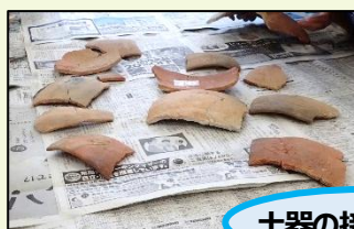
土器の接合と復元

土器のほとんどは割れて見つかります。センターでは、そのような土器を接合し復元する仕事もしています。小学校の職場体験では「土器の接合・復元」を、レプリカの土器を用いて体験します。作業をとおして、歴史を伝える仕事について学びます。