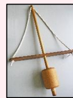
火起こし道具 マイギリ

古代の火起こし道具「マイギリ」を使って、4人1組で火を起こします。力を合わせる事がコツです。