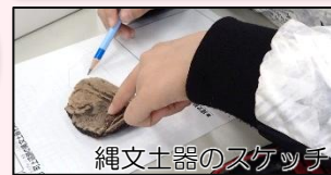
縄文土器のスケッチ