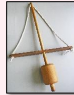
火起こし道具 マイギリ

古代の火起こし道具「マイギリ」を使って、4人1組で火を起こします。力を合わせる事がコツです。