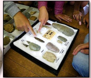
縄文時代の石器を触る