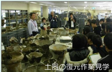
土器の復元作業見学

普段見ることのできない土器の復元作業、鉄製品・木製品の保存処理などの仕事や収蔵庫を見学します。