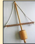
火起こし道具 マイギリ

古代の火起こし道具「マイギリ」を使って、4人1組で火を起こします。力を合わせることがコツです。