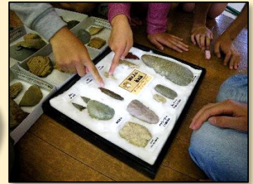
縄文時代の石器を触る