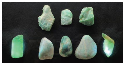
縄文時代のヒスイ原石・剥片(糸魚川市六反田南遺跡)

2022年11月4日にヒスイが新潟県の「県の石」に指定されました。新潟県はヒスイ産地として国内最大の規模を誇るとともに、宝石の素材となる透明度が高い良質なヒスイが産出される唯一の産地です。当館でも常設展示「縄文時代のアクセサリー」コーナー等でご覧になることができます。