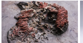
縄文時代の赤漆塗り糸玉(新発田市青田遺跡・県指定)