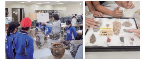
土器の復元作業などの見学

本物の縄文土器を用いた歴史学習や、火起こし・勾玉作りなどの体験学習、仕事見学ができる校外学習を受け入れています。また、当センター職員が学校に向出前授業や、当センターならではの専門的な仕事ができる職場体験も行っています。ぜひご利用ください。