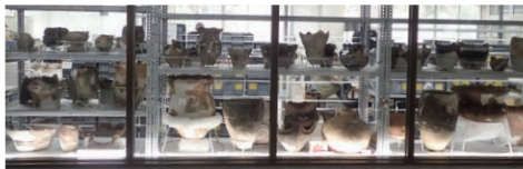
2F 村上市上野遺跡出土品展示コーナー