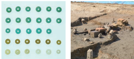
ガラス製数珠玉(柏崎市丘江遺跡)

国道8号柏崎バイパスの発掘調査で中世遺跡が多く発見されています。集落、信仰等をテーマに展示。また、柏崎市教育委員会が発掘調査を行った柏崎町遺跡、馬場・天神腰遺跡などの展示も予定。丘江遺跡の金箔付木製塔婆(全国2例目)は春・秋2回実物を展示します。