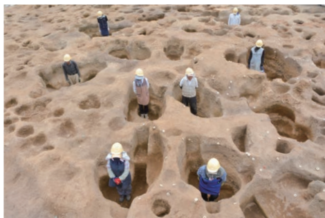
大型掘立柱建物(村上市上野遺跡)

最新の発掘調査や整理作業の成果を出土品や写真で解説します。2025年度に発掘調査を行う村上市上野遺跡などを展示します。初公開の出土品多数!