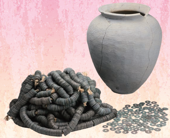
珠洲焼の壺に納められていた大量のお金(柏崎市東原町遺跡)