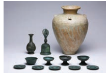
青銅製五鈴鉾かごと瀬戸四耳壺(上越市木崎山遺跡・県指定)