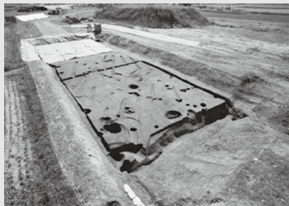
〔南魚沼市六日町藤塚遺跡〕全景