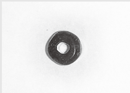
〔上越市三和区弥五郎遺跡〕古墳時代のガラス玉