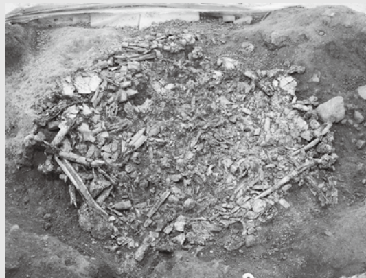
〔村上市上野遺跡〕焼人骨集積土坑