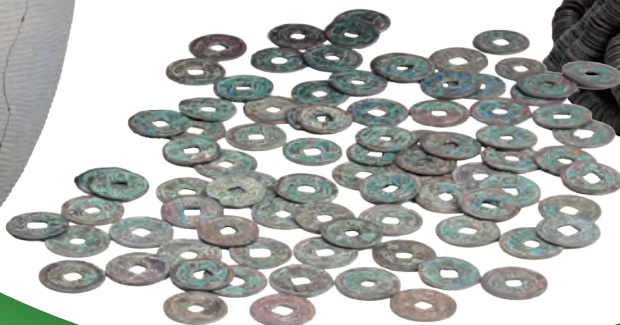
〔東原町遺跡〕渡来銭

国道8号柏崎バイパスの建設に伴い、 中世の遺跡が多数発見されています。 全国で2例目の丘江遺跡出土金箔付木製塔婆は 大きな話題となりました。 また東原町遺跡出土の1万枚を超える渡来銭は 見る者を圧倒します。