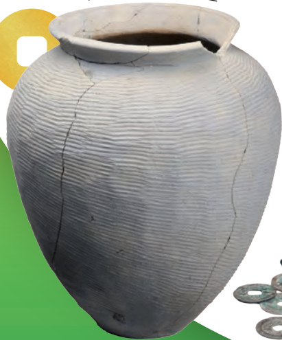
〔東原町遺跡〕珠洲焼壺

国道8号柏崎バイパスの建設に伴い、 中世の遺跡が多数発見されています。 全国で2例目の丘江遺跡出土金箔付木製塔婆は 大きな話題となりました。 また東原町遺跡出土の1万枚を超える渡来銭は 見る者を圧倒します。