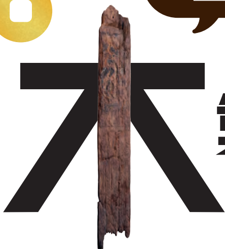
金箔付木製塔婆(1号)