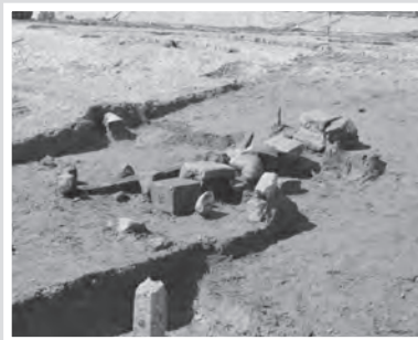
丘江遺跡階段状施設