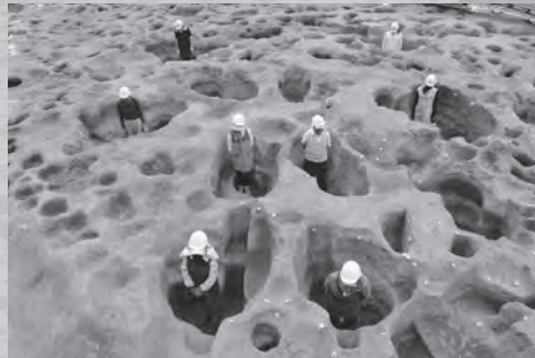
〔村上市上野遺跡〕大型掘立柱建物