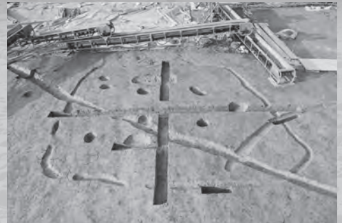
〔柏崎市丘江遺跡〕弥生時代竪穴建物