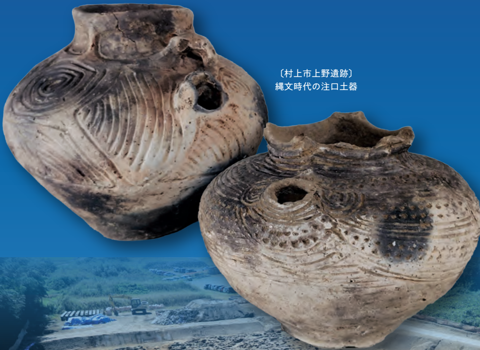
〔村上市上野遺跡〕 縄文時代の注口土器