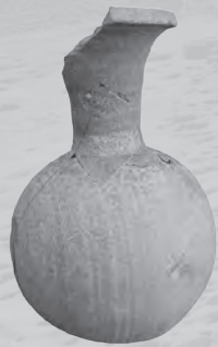
〔南魚沼市六日町藤塚遺跡〕 7～8世紀のフラスコ形埴瓶