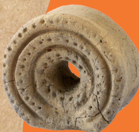
〔上越市下割遺跡〕 縄文時代の耳飾り