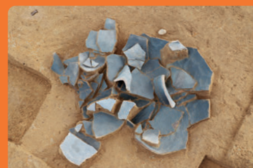
〔南魚沼市六日町藤塚遺跡〕 古墳時代の須恵器甕出土状況