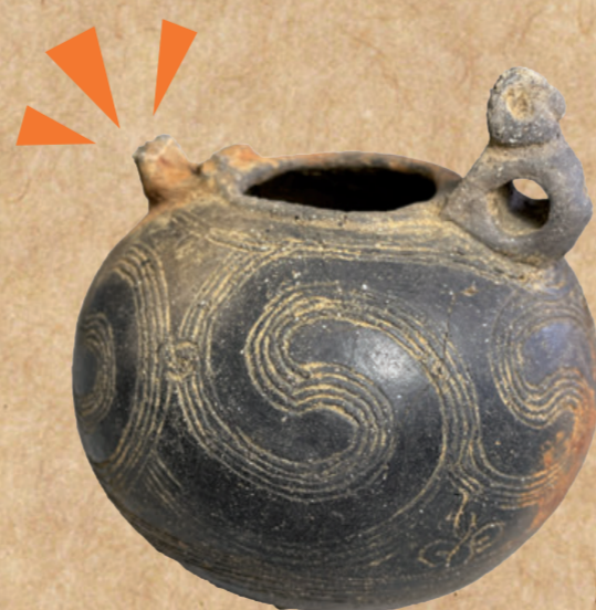
〔村上市上野遺跡〕 縄文時代の注口土器