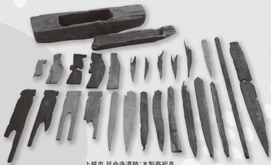
上越市 延命寺遺跡：木製祭祀具

現在の新潟県本州側、 越後の国域が確定したとされる 西暦712年。 越後国域確定1300年事業を実施してから 10年が経過しましたが、 その後の発掘調査や研究成果を踏まえ、 西暦712年前後の越後の歴史に迫ります。