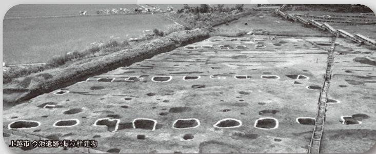
上越市 今池遺跡：掘立柱建物