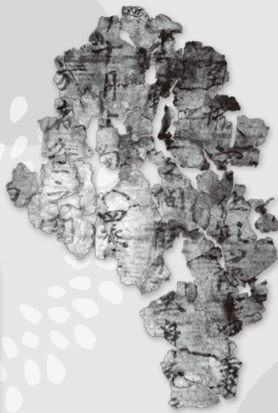
村上市 西部遺跡： 「頸城宮」の文字がある漆紙文書