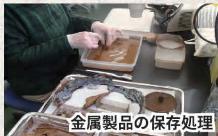
金属製品の保存処理

遺物観察・体験では、そんな縄文時代の人々が作った本物の土器や石器などを間近で見たり、実際に触りながら、その技術や使い方などを観察します。 無料