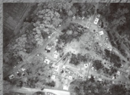
新潟市瓦塚遺跡古墳・人形古墳の空中写真