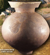
新潟県埋蔵文化財センター (弥生時代) 第2会場