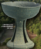
三上市管内三王山 12号墓の銅製鉢高杯 (第1会場)