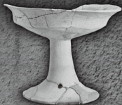
加茂市中沢遺跡の高杯 (弥生時代)第1発掘

中国の歴史書に、大いに乱れた倭国を卑弥呼が治めた、記された弥生時代後期から国家が成立する7世紀まで、越後平野は西側の情報が伝わる日本海側最北の地でした。一方で、北方の情報出土品が伝わる最も南の地でもありました。発掘調査出土品から、この地域の重要性に迫ります。