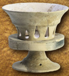
新潟県平野市上寺村遺跡の 銅製高杯(弥生時代) 第1会場