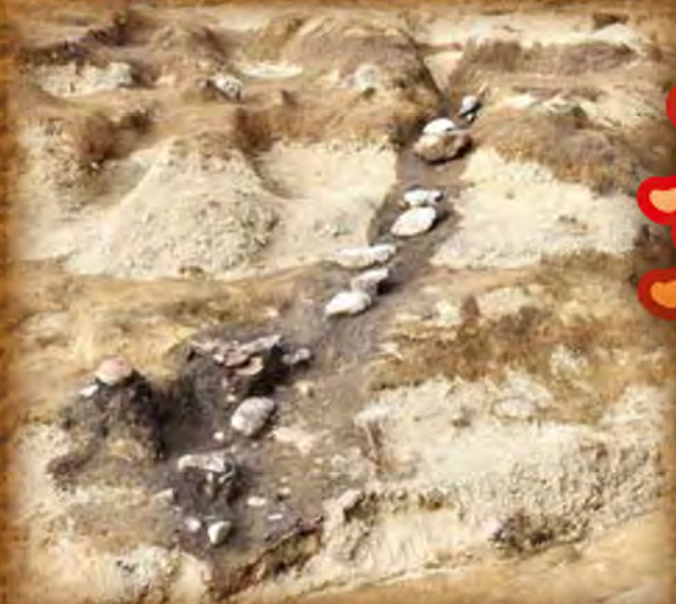
村上市上野遺跡 低地から上る階段状遺構