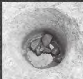
上越市館遺跡 遺物出土状況