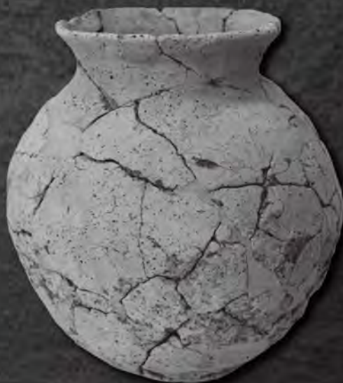
上越市下割遺跡 古墳時代の土師器壺