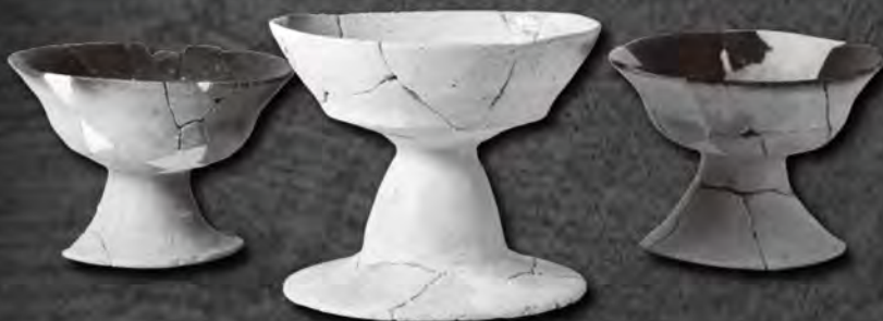
南魚沼市六日町藤塚遺跡 古墳時代の高杯