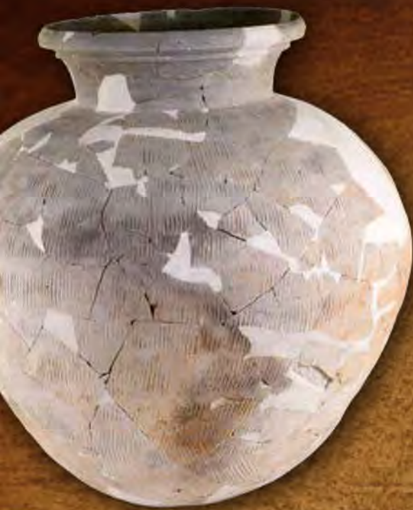
南魚沼市六日町藤塚遺跡 古墳時代の甕