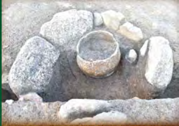
村上市上野遺跡 縄文時代の石囲炉