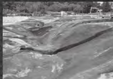
村上市上野遺跡 谷の検出