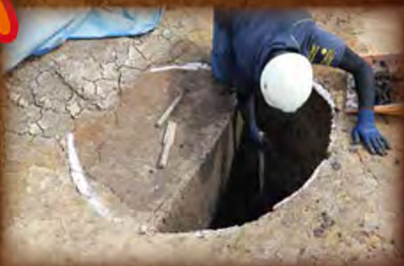
上越市下割遺跡 作業風景