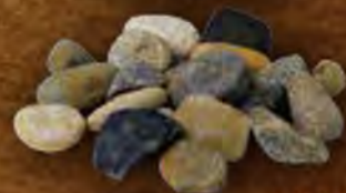
上越市下割遺跡 古墳時代の黒色土器鉢と中に入っていた際