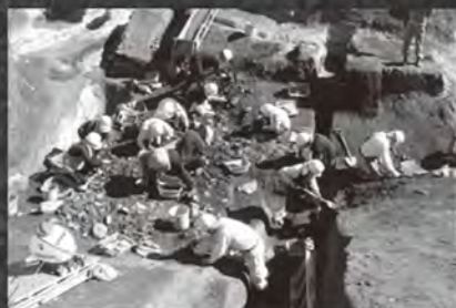
村上市上野遺跡 作業風景