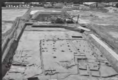
村上市竹ノ下遺跡 遺跡全景