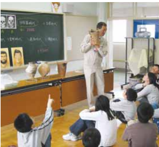
出前授業の様子(新潟市立真砂小学校)

毎年、春と秋に体験を希望する学校が集中します。そこで、訪問を希望されても、すでに予定が入っていてお断りすることもありました。当センターでは、出土遺物や体験道具などを持って学校を訪問する「出前授業」も行っていますので、センターまで来られない場合などは、ぜひご検討ください。