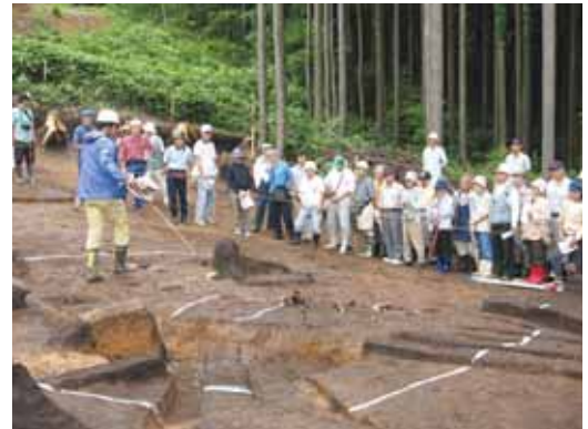
現地説明会(村上市東興野遺跡)

平成19年度も発掘調査の成果をご覧いただくために、現地説明会を開催してきました。6月15日の新潟市西郷遺跡 にしじょう を皮切りに、19遺跡で計23回行い、2,300人以上の方々からご参加いただきました。発掘調査に対する皆様の関心の高さを改めて感じ、今後も調査成果を県内外の皆様にお伝えできるよう、現地説明会を開催いたします。