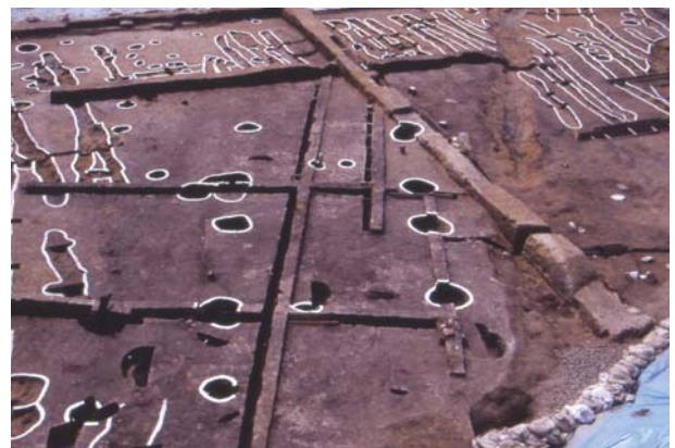
写真3 盛土の上に建てられた建物