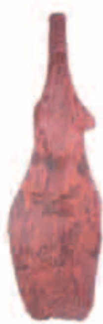
北沖東遺跡出土 古墳時代前期の ナスビ形農耕具