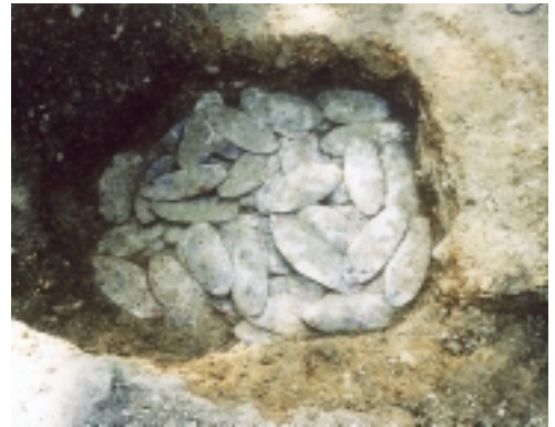
鉛の延べ板出土状況