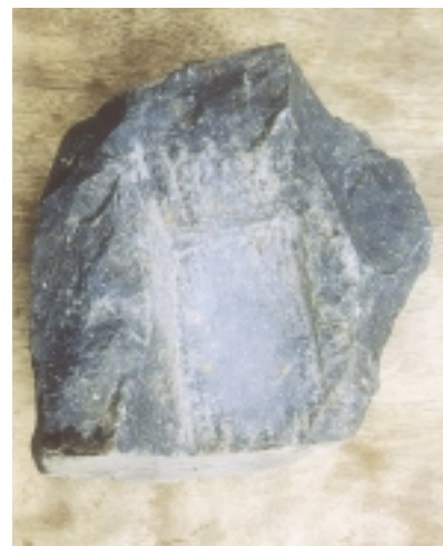
四角い穴が穿たれている叩石