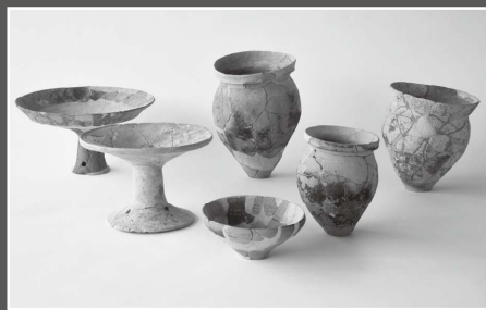
上越市裏山遺跡 弥生時代土器 [県指定]