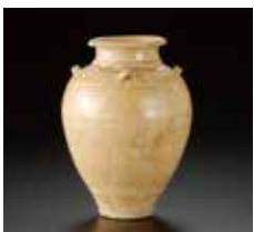
白磁四耳壺(長岡市十家寺白山神社)

新潟県では古代の阿賀野市山口遺跡 とうさんさい の唐三彩 にさい をはじめ、奈良三彩 にさい 、二彩陶器 えっしゅうせいじ 、越州窯青磁 りよく 、釉陶器 かいゆう 、灰釉陶器等 かいゆう 等が出土しています。中世は青磁 はくじ ・白磁 せとみ 、瀬戸 ひぜん ・美濃焼 ひぜん 、中近世の朝鮮陶磁器 ひぜん 、近世の肥前陶磁器 ひぜん 、瀬戸焼 ひぜん 等が遺跡から出土します。これらの施釉陶磁器が越後・佐渡にもたらされた日本海流通等について考えます。