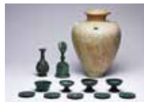
青銅製五鈺鈴はかと古瀬戸四耳壺(上越市木崎山遺跡・県指定)