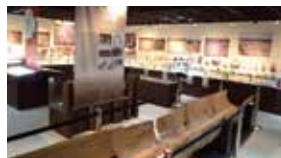
常設展示室と鎌倉時代の丸木舟(阿賀野市石船戸東遺跡)

県内の旧石器時代から江戸時代の様子を概観できる通史展示のほか、縄文時代の赤漆塗り糸玉や鎌倉時代の大型丸木舟など当センター選りすぐりの収蔵品約500点をご覧ください。タブレット音声解説機やクイズコーナーもあり、歴史に親しんでいただける内容となっています。