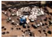
縄文時代後期の敷石建物 (上野遺跡)