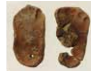
縄文時代晩期末～ 弥生時代初期の 足型土版 (新潟市西郷遺跡)

定員：第1回・第2回／各16名 (第1回・第2回はセットで申込必要、 先着順) 第3回／10名 (申込必要、先着順) 受付：第1回・第2回は4/8(月)～5/22(水) 第3回は9/2(月)～11/6(水)