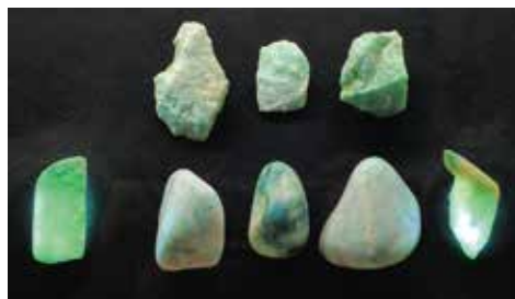
縄文時代のヒスイ原石・剥片(糸魚川市六反田南遺跡)

2022年11月4日にヒスイが新潟県の「県の石」に指定されました。新潟県はヒスイ産地として国内最大の規模を誇るとともに、宝石の素材となる透明度が高い良質なヒスイが産出される唯一の産地です。当センターでも常設展示「縄文時代のアクセサリ」コーナー等でご覧になることができます。