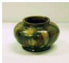
奈良三彩の小壺(新潟市上浦遺跡)新潟市文化財センター所蔵