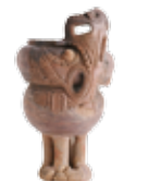
縄文土器 脚付土器(南魚沼市五丁歩遺跡・県指定)