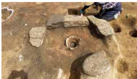
縄文時代の石田炉(村上市上野遺跡)

最新の発掘調査や整理作業の成果を出土品や写真で解説します。2024年度に発掘調査を行う村上市上野遺跡などを展示します。初公開の出土品多数!