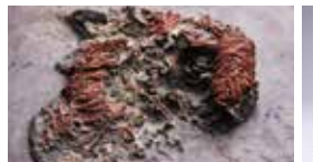
縄文時代の赤漆塗り糸玉(新発田市青田遺跡・県指定)