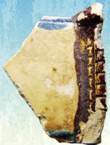
県内唯一の唐三彩(阿賀野市山口遺跡)