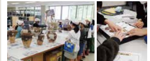
土器の復元作業などの見学

本物の縄文土器を用いた歴史学習や、火起こし・勾玉作りなどの体験学習、仕事見学ができる校外学習を受け入れています。また、当センター職員が学校に出向く出前授業や、当センターならではの専門的な仕事ができる職場体験も行っています。ぜひご利用ください。