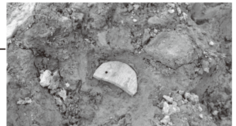
南魚沼市 六日町藤塚遺跡 古墳時代の勾玉形石製模造品

阿賀野市土橋北遺跡(縄文時代後期～晩期)・阿賀野市石船戸東遺跡(中世)・南魚沼市六日町藤塚遺跡(古墳時代中期)・柏崎市丘江遺跡(中世)・柏崎市宝田遺跡(古代～中世・近世)の出土品・パネル展示