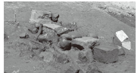
柏崎市 丘江遺跡 中世の階段状施設