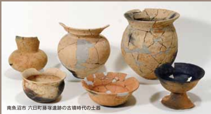
南魚沼市 六日町藤塚遺跡の古墳時代の土器

遺跡発掘調査報告会で 報告する5遺跡の 出土品・パネル展示 初公開の出土品多数!