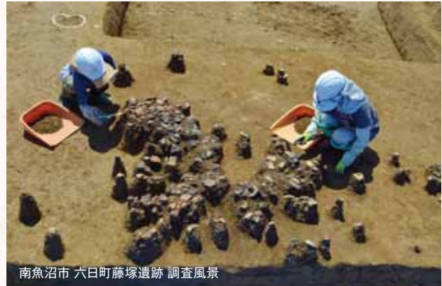
南魚沼市 六日町藤塚遺跡 調査風景