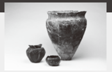
新潟市青田遺跡の縄文土器【県指定】