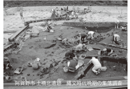
阿賀野市 土橋北遺跡 縄文時代晩期の集落調査