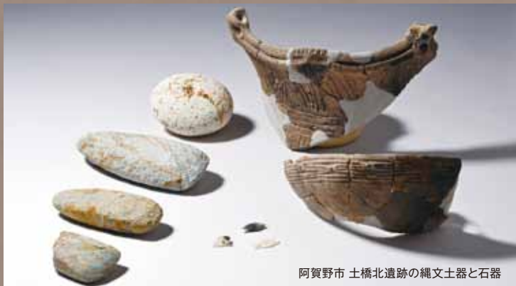
阿賀野市 土橋北遺跡の縄文土器と石器