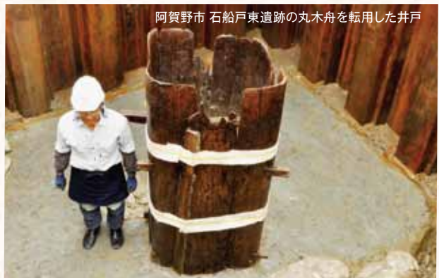
阿賀野市 石船戸東遺跡の丸木舟を転用した井戸