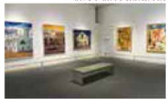
コレクション展 会場風景