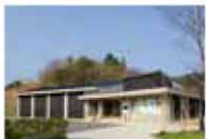
弥生の丘展示館外観