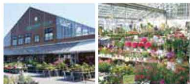
新津フラワーランド外観