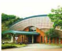
新潟県埋蔵文化財センター外観