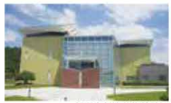
新潟市新津美術館外観