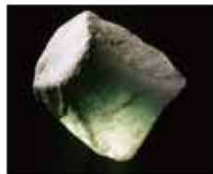
世界最古のヒスイ製石器