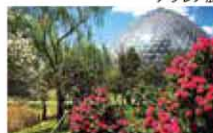
シャクナゲと観賞温室